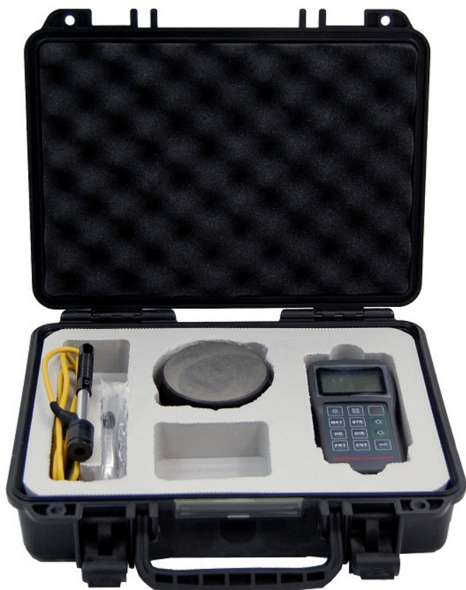
*Sonde tipo DC, D15, C, E, G, DL (opzionali)